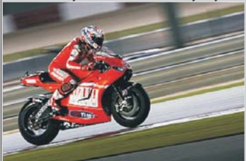
Octubre 3 del 2010

El australiano Casey Stoner se adjudicó su primera victoria de la temporada al imponerse en el Gran Premio de Aragón de MotoGP que se disputó en el circuito Motorland Aragón, en donde le acompañaron en el podio los españoles Dani Pedrosa y el estadounidense Nicky Hayden.