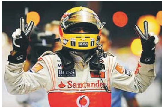
Lewis Hamilton ganó de punta a punta en Bélgica.

Agosto 29 del 2010 El británico Lewis Hamilton se ha adjudicado la victoria en el Gran Premio de Bélgica, por delante del australiano Mark Webber y del polaco Robert Kubica El brasileño Felipe Massa ha terminado en cuarta posición, por delante del alemán Adrian Sutil y de los alemanes Nico Rosberg y Michael Schumacher. Octavo ha sido el japonés Kamui Kobayashi, noveno el ruso Vitaly Petrov y décimo Jaime Alguersuari.