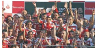
Septiembre 12 del 2010

Agosto 29 del 2010 El británico Lewis Hamilton se ha adjudicado la victoria en el Gran Premio de Bélgica, por delante del australiano Mark Webber y del polaco Robert Kubica El brasileño Felipe Massa ha terminado en cuarta posición, por delante del alemán Adrian Sutil y de los alemanes Nico Rosberg y Michael Schumacher. Octavo ha sido el japonés Kamui Kobayashi, noveno el ruso Vitaly Petrov y décimo Jaime Alguersuari.