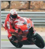
Septiembre 19 del 2010

El australiano Casey Stoner se adjudicó su primera victoria de la temporada al imponerse en el Gran Premio de Aragón de MotoGP que se disputó en el circuito Motorland Aragón, en donde le acompañaron en el podio los españoles Dani Pedrosa y el estadounidense Nicky Hayden.