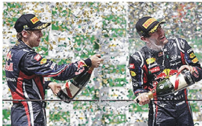
Webber y Vettel hicieron el 1-2 en Interlagos en el Gran Premio de Brasil

Noviembre 13 del 2011 Gran Premio de Abu Dabi. El británico Lewis Hamilton logró la victoria en el Gran Premio de Abu Dabi, penúltima prueba del Mundial de Fórmula Uno, en la que el español Fernando Alonso se clasificó segundo y Jenson Button, Mark Webber cuarto autor de la vuelta rápida. La zona de puntos la completaron el brasileño Felipe Massa, que hizo un trompo a cinco vueltas del final; los dos pilotos alemanes de Mercedes Nico Rosberg y Michael Schumacher, los dos de Force India, el germano Adrian Sutil y el británico Paul di Resta, y el japonés Kamui Kobayashi, el alemán Sebastian Vettel tuvo que abandonar en la primera vuelta. La carrera de Sergio Pérez fue muy buena ya que por un momento en la carrera, después de haber tenido un contacto con DiResta en la arrancada, cayó al último lugar y se las arregló para regresar a los lugares que rondan los puntos. Para muestra de la evolución del mexicano, otra vez una buena arrancada que gana tres lugares, incluido el de DiResta al cerrar la vuelta número uno. Checo fue recuperando y cuando llegó al décimo puesto y se encaminaba a emprender un ataque sobre Force India, su KERS falló y Kobayashi le arrebató el lugar. Todavía, a puras manos, se defendió de Barrichello quien cruzó la meta a sólo .7 segundos de Pérez. Un buen trabajo que, desgraciadamente, no se vio compensado con puntos para Checo.