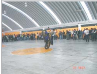
En el festejo del aniversario XV de la peregrinación de motociclistas se presentó la exhibición de acrobacia en moto deportiva mostrando un gran control presentado en el Gimnasio Metropolitano de Ciudad Neza.