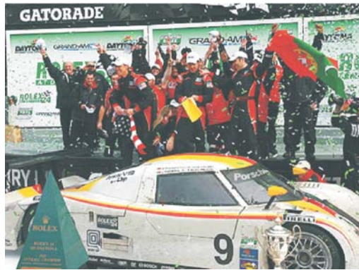
El Action Express se adjudico el triunfo en las 24 horas de Daytona