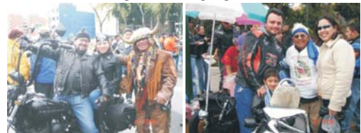
Barrios y el Padrino motociclistas El Abuelo el motociclista en activo entusiastas que asistieron a la mas longevo del grupo mostrando peregrinación.