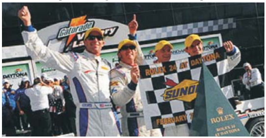
El Brumos Racing gana las 24 hrs. De Daytona