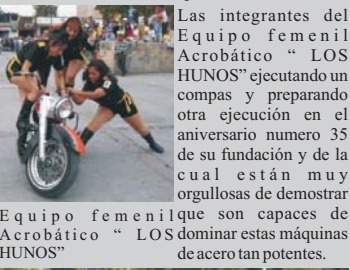
Las integrantes del Equipo femenil Acrobático " LOS HUNOS" ejecutando un compas y preparando otra ejecución en el aniversario numero 35 de su fundación y de la cual están muy orgullosos de demostrar Equipo femenil que son capaces de Acrobático " LOS dominar estas máquinas HUNOS" de acero tan potentes.