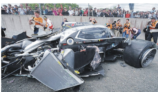
Así terminó el automóvil del escocés Allan McNish