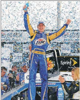
Kurt Busch ganó dos carreras el domingo: la Kobalt Tools 500 y la Carl Edwards 25.

En una carrera que se extendió 16 vueltas - casi 40 Km. (25 millas) - de su distancia programada, luego que Edwards se vengó de Brad Keselowski por un incidente a inicios de la carrera de la Copa Sprint de NASCAR en el Atlanta Motor Speedway, Busch se aprovechó de un reinicio sódido para tomar el liderazgo en el segundo intento de un reinicio bajo bandera verde-blanca-a cuadros y cruzó la meta 0.482 segundos de Matt Kenseth, quien fue segundo. Juan Pablo Montoya, quien se acercaba a Busch cerca del final de las 325 vueltas programadas, finalizó tercero, pero perdió su oportunidad para pelear por la victoria cuando Edwards golpeó al No. 12 Dodge de Keselowski en la recta delantera y lo mandó volando en la vuelta 323. Kasey Kahne, quien finalizó cuarto, lideró la mayor cantidad de vueltas (144), pero su auto experimentó subviraje al final de la carrera. Paul Menard llegó quinto y AJ Allmendinger sexto, lo que le da al Richard Petty Motorsports un resultado en 4-5-6, el mejor resultado de la organización desde que anunció el cambio de Dodge a Ford a finales del año pasado. Brian Vickers, Greg Biffle, Kevin Harvick y Scott Speed cerraron los 10 primeros.