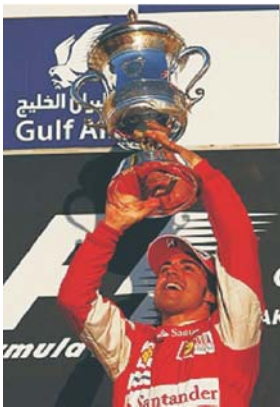
Alonso se impuso con su Ferrari en el GP de Bahrein

Marzo 14 del 2010 Fernando Alonso ha logrado su primera victoria como piloto de Ferrari al imponerse en el Gran Premio de Bahrein, primera prueba del mundial de Fórmula Uno, por delante de su compañero de equipo, el brasileño Felipe Massa y el británico Lewis Hamilton. Después de haber transitado detrás de Sebastian Vettel durante más de dos tercios del Gran Premio de Bahrein, el asturiano aprovechó la pérdida de potencia del motor Renault del Red Bull para tomar la punta en la Partida, en el pique hacia la primera curva del remozado -y empeorado- circuito bahreiní. apuró a su compañero Felipe Massa lo emparejó por afuera en la salida y lo superó en el segundo viraje, a la izquierda, con la cuerda a favor. Aquella movida marcó el orden interno de Ferrari en la primera de las 19 fechas de 2010. La perseverancia de Alonso para mantenerse cerca de Vettel aunque durante buena parte del recorrido su esfuerzo pareciera estéril al final rindió. Suprimidas las paradas en boxes para reabastecimiento de combustible, la mayoría eligió una estrategia de detención única para cambio de neumáticos.