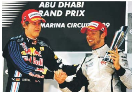
Dos campeones saludándose Vettel ganador de Abu Dhabi y Sebastián Vettel campeón del mundo Formula Uno 2009.

adjudicado Vettel por delante del brasileño Rubens Barrichello que ha sido cuarto en la carrera, la lucha por el tercer puesto en el mundial de constructores se ha quedado como estaba, con McLaren-Mercedes tercero con un punto de ventaja sobre Ferrari. Lo más destacado de esta última carrera del mundial ha sido el sexto puesto conseguido por el japonés Kamui Kobayashi, que disputaba su segunda carrera en Fórmula Uno en sustitución del alemán Timo Glock y que ha sumado sus primeros tres puntos, lo que seguramente le dará el volante del coche para la próxima temporada.